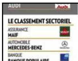
Ces marques que leurs clients plébiscitent