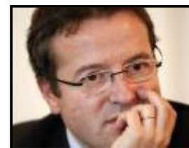
RSA : Martin Hirsch riposte et accuse

Dernier commentaire publié pour cet article