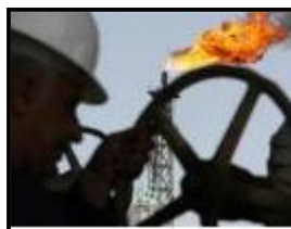
La facture énergétique de la France a ...