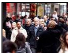
La hausse des créations d'emploi se poursuit