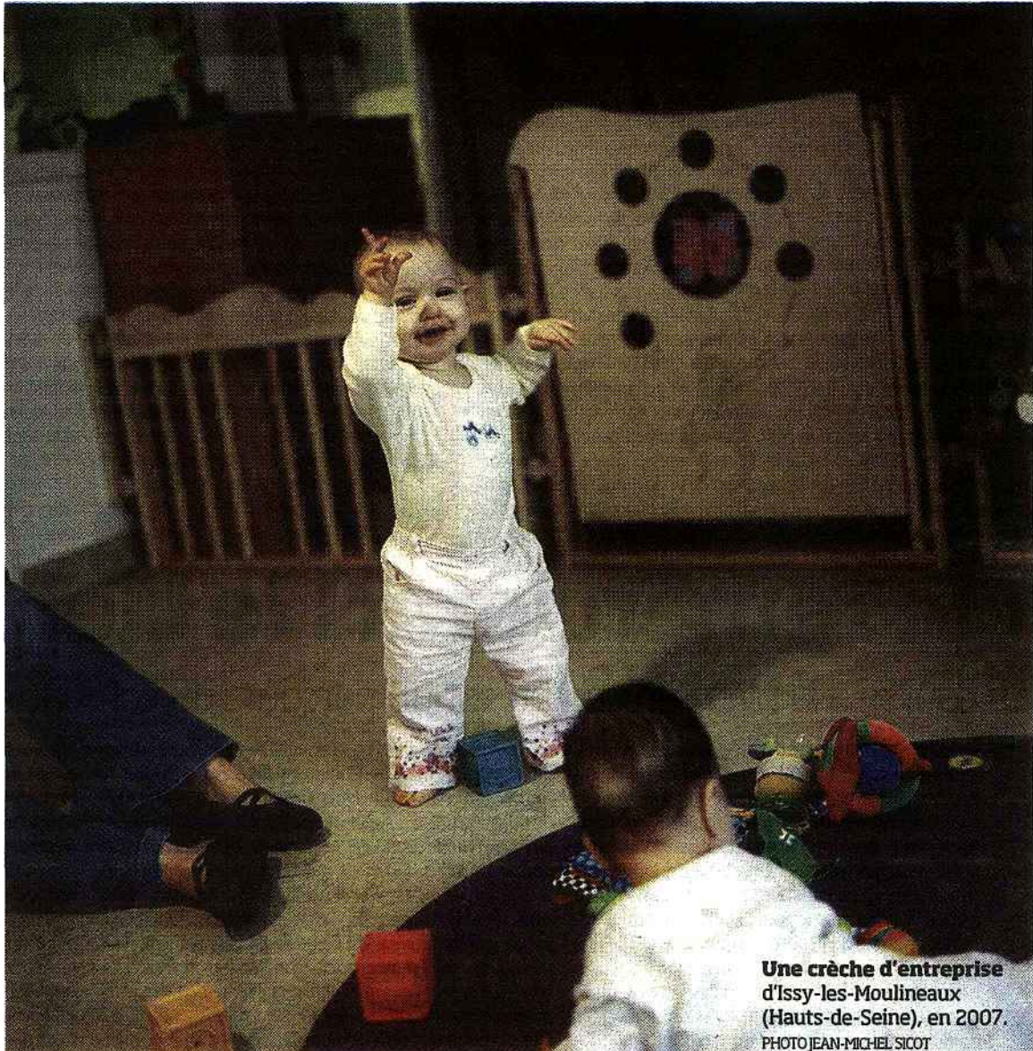
Une crèche d'entreprise d'Issy-les-Moulineaux (Hauts-de-Seine), en 2007.